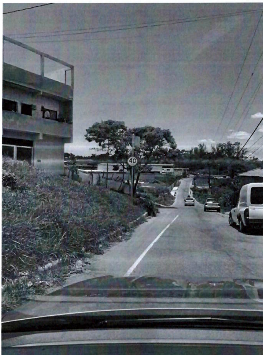
Foto – Sentido Decrescente

ANEXO I- LEVANTAMENTO TÉCNICO - CONTROLADOR DE VELOCIDADE: LEVANTAMENTO PARA O LOCAL DE INSTALAÇÃO DOS EQUIPAMENTOS